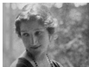
Antonieta Rivas Mercado