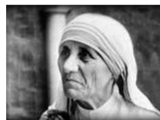
Madre Teresa de Calcuta